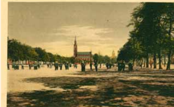
Abbildung: Postkarte aus der Sammlung Fred Liebholz Handschriftlicher Vermerk: Exerzier und Paradeplatz unseres Regiments

16. April 2015 – 12. Juli 2015 Museum Viadrina, Junkerhaus