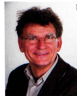
Der Kulturwissenschaftler und Ethnologe Werner Schiffauer forscht zur Genese des Islamismus. Er plädiert für eine Strategie der Aufklärung statt der Dämonisierung.

„Salafiya“ bedeutet lediglich Orientierung an der Urgemeinde, also die Verwirklichung religiöser Ideale in ihrer reinsten Form – ein Interpretationsansatz, wie wir ihn auch aus dem Christentum kennen. Das heißt, die Salafiten sind primär eine religiöse Bewegung. Sie haben vor allem in der älteren Generation Anhänger. Darüber hinaus gibt es aber einen politischen Salafismus, der auf den antikononialen Widerstand im 19. Jahrhundert zurückgeht. Der heutige Wahhabismus gehört dazu. Er postuliert eine grundlegende Opposition zwischen dem Westen und dem Islam, engagiert sich für eine Islamisierung der Gesellschaft, ist aber