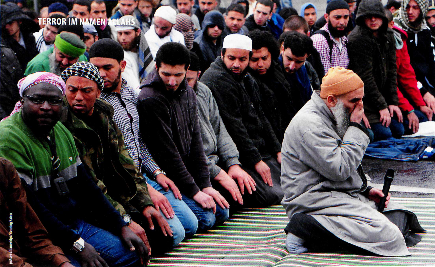
Das Unbehagen an einer Welt, die aus den Fugen geraten ist, weckt das Bedürfnis nach Orientierung und einer Einteilung in Gut und Böse ...