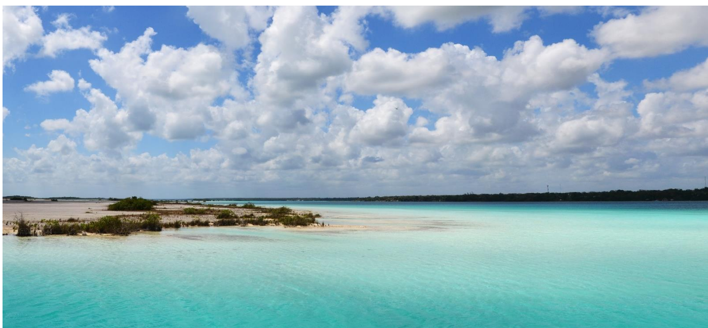
Bild 1: Sonnenuntergänge in La Paz, Baja California Sur; Bild 2: Bucht von Mazunte, Oaxaca; Bild 3: wunderschöne Lagune de Bacala