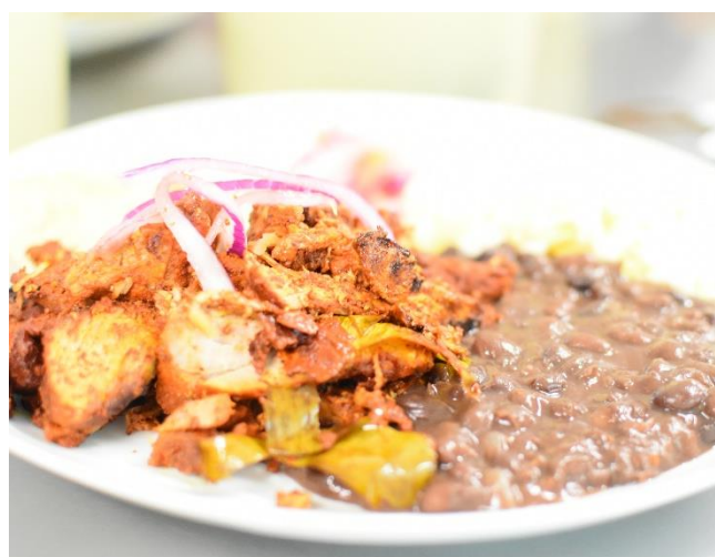
Bild 1: Park Edward James, Xilitla; Bild 2: Wasserfälle Huasteca Potosiana; Bild 3: Mexiko-Stadt; Bild 4: Hierve al Agua; Bild 5: Kolonialstadt San Miguel de Allende; Bild 6: eines der selbstgekochten mex. Gerichte aus meinem mex. Kochkurs ☺