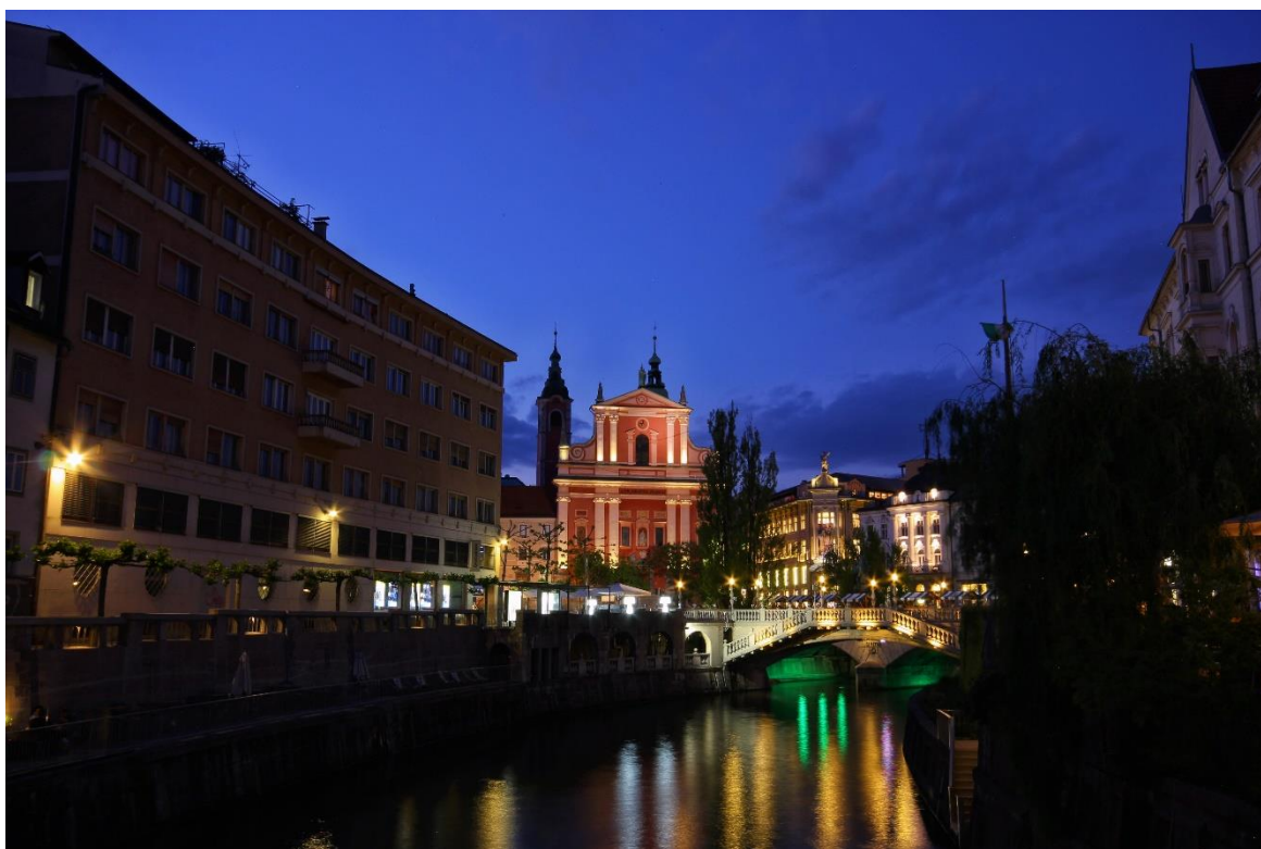
Die Altstadt von Ljubljana mit der ikonischen Pink Church.