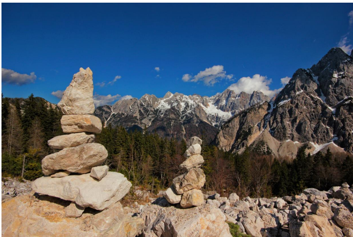
Wandern in den Alpen.