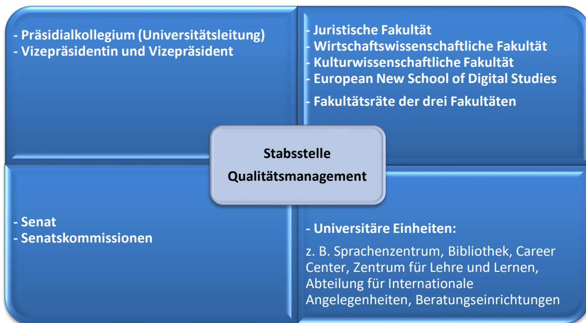
Abbildung 1. Verankerung des Qualitätsmanagements für den Bereich Studium und Lehre an der Viadrina

Das Qualitätsmanagement ist als Stabsstelle dem Vizepräsidenten für Studium und Lehre und der Vizepräsidentin für Transfer und Campus zugeordnet. Zugleich ist die Stabsstelle direkt vernetzt mit den Fakultäten und ihren Fakultätsräten, mit dem Senat, den Senatskommissionen und den universitären Einheiten. Diese Vernetzung – visualisiert in Form der folgenden Abbildung 1 – trägt einerseits den fachspezifischen Besonderheiten innerhalb der Fakultäten und andererseits dem fach- und fakultätsübergreifenden Charakter des Qualitätsmanagementsystems Rechnung.